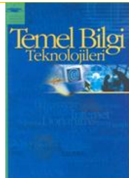
Temel Bilgi Teknolojileri, Anadolu Üniversitesi Yayınları,

İnsanlık tarihinde uzun bir dönem boyunca toprağa sahip olanlar, onu başkalarından daha başarılı biçimde işleyenler zenginliğin ve gücün sahibi oldu. Sanayi Devriminden sonra toprak önemini kaybetmeye başladı. İnsan, doğada saklı olanı açığa çıkarıp başarıyla işlemeyi hedef olarak seçti. Malzemeyi başkalarından daha yüksek başarıyla işlemek, zenginliğin ve gücün anahtarı oldu. Bugün Bilgi Devriminin içinde yaşıyoruz. Yakın gelecekte, zenginlik ancak bilgiyi başarıyla işlemekle üretilebilir olacak. Bilgi teknolojileri, bu yüzden, bugünün dünyasına kendisini hazırlamak isteyenlerin ihmal edemeyeceği kadar önem kazandı. Bilgi teknolojileri sadece kurum ve kuruluşların ihtiyacı değildir. Bugünün dünyasında yerini almak isteyen her birey, kendi günlük hayatını kelime işlemciler, hesap tabloları, çizim, resim, sunum programları, veri tabanları gibi olanaklar yardımıyla zenginleştirebilir. Temel Bilgi Teknolojileri dersi, sizleri, sözü edilen olanaklarla tanıştırmak için hazırlandı.