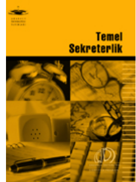
Temel Sekreterlik, Anadolu Üniversitesi Yayınları, 2008.

Değişen çalışma koşulları ve yöneticinin değişen çevresi karşısında sekreterin kendini sürekli geliştirmesi ve yenileyebilmesi önemli hale gelmiştir. Temel Sekreterlik kitabının içeriği sekreterlerin verimliliğini ve performansını yükseltmelerini hedeflemektedir.