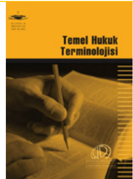
Temel Hukuk Terminolojisi, Anadolu Üniversitesi Yayınları, 2008.

Temel Hukuk Terminolojisi, hukuk kurallarının özellikleri, kaynakları ve hukukun temel kavramları konularında, uzaktan öğretim kapsamında, hukuk hakkında yeterli bilgiye sahip olmayan öğrencilerimize genel bilgiler vermeyi amaçlamaktadır.