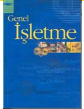
Genel İşletme, Anadolu Üniversitesi Yayınları, 2005.

Genel İşletme dersinde toplumsal yaşamın vazgeçilmez kurumlarından olan "işletmeler" her yönüyle ele alınmıştır. Anadolu Üniversitesi öğretim üyeleri tarafından kaleme alınan Genel İşletme kitabı, farklı alanlarda çalışan geniş bir akademik kadronun katkılarıyla ortaya çıkmıştır. Genel İşletme dersine ait e-öğrenme hizmetleri sağdaki bölümde listelenmiştir, e-Sertifika Programları Portalından bu hizmetlere erişebilirsiniz.